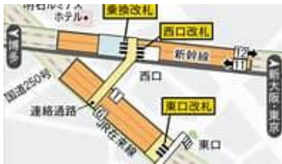
(新幹線等利用 集合場所) 新幹線西明石駅 在来線西口改札